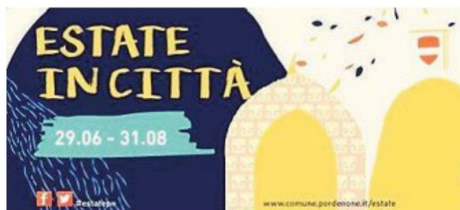
La cartolina "Note dal fronte" e la Zerorchestra che aprirà "Estate in città"