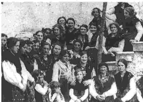
DOCUMENTARIO Nuova versione per “La sentinella della Patria”

La nuova “Sentinella” sarà presentata in anteprima giovedì prossimo a Udine (giardino Loris Fortuna, piazza 1. Maggio, 21.30), venerdì 16 a Gemona (parco di via Dante, 21.30) e sabato 17 a Sacile (Corte di Palazzo Ragazzoni, 21.15). Previste sedi alternative al coperto in caso di pioggia. Le musiche composte da Glauco Venier per la prima versione, in base a un repertorio di canti e villotte della tradizione friulana, sono state orchestrate dal maestro Michele Corcella, che dirigerà nell'accompagnamento dal vivo un inedito ensemble formato dai musicisti della Zerorchestra e dell'Accademia musicale Naonis di Pordenone. Completa lo spettacolo