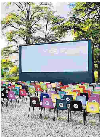
Lo schermo in piazza I Maggio